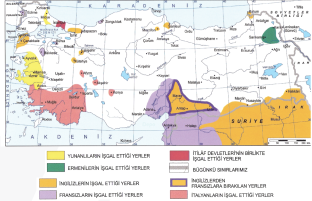
Mondros Ateşkes Antlaşması Sonrası İşgal Edilen Yerler Haritası